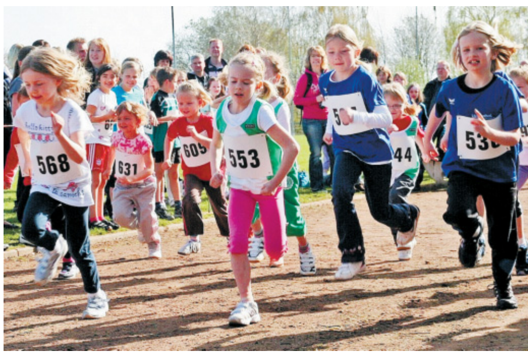
Mit Spaß am Start: Diese Mädels nahmen voller Elan die 850-Meter-Distanz in Angriff. Insgesamt 79 Kinder und Jugendliche kämpften beim Waldlauf in Steinhausen um die Stadtmeister-Titel.