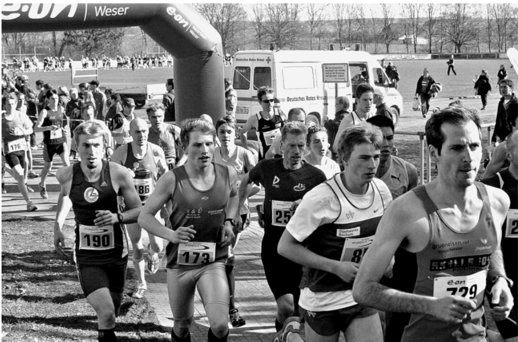
Dichtes Gedränge: Wenige Meter nach dem Start liegt das Feld der 10-Kilometer-Läufer am „Marathonort“ des Hederauen-Stadions noch eng zusammen. Die Teilnehmer im Hintergrund auf der anderen Seite des Fußballfeldes lassen es etwas gemächlicher angehen.